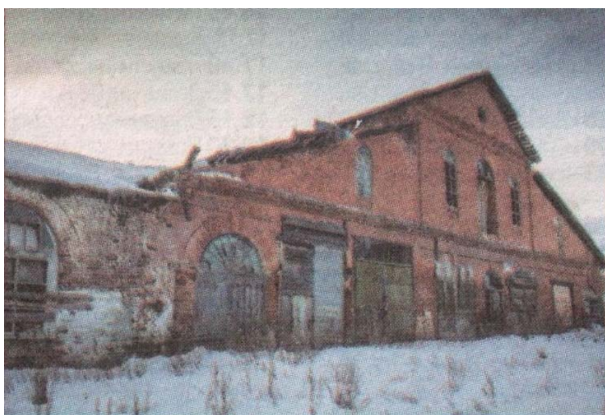
Корпус бывшего чугуноплавильного завода

Когда-то в этом селе чуть не до самой Великой Отечественной войны работал чугуноплавильный завод (всего в наших краях в разные века было 13 заводов).